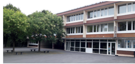
ÉCOLE Paul LANGEVIN Rue Paul Vaillant Couturier Tél : 03.82.26.20.85