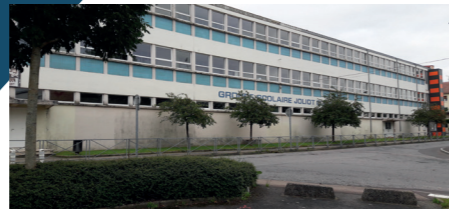
ÉCOLE JOLIOT CURIE Place Joliot Curie Tél : 03.82.89.02.83