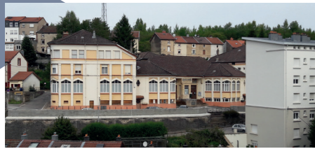
ÉCOLE Raymond POINCARE 3 rue Roosevelt Tél : 03.82.89.43.24

Votre enfant est accueilli dans une des cinq écoles élémentaires de la Ville de Villerupt :