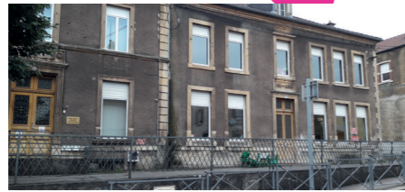
ÉCOLE Jules FERRY 16 Rue Georges Clémenceau Tél : 03.82.89.43.09