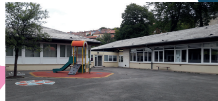
ÉCOLE BARA 2 Rue de Verdun Tél : 03.82.89.10.90